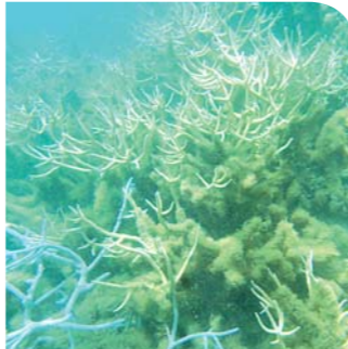
Gazon algal et coraux branchus