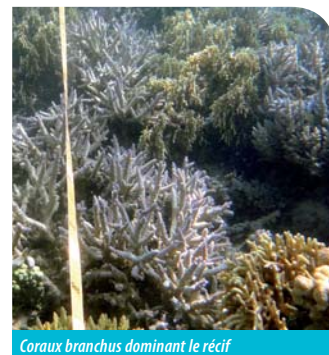
Coraux branchus dominant le récif