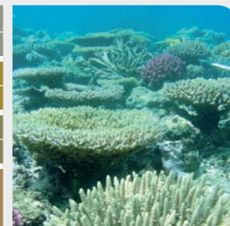
Une couverture corallienne élevée