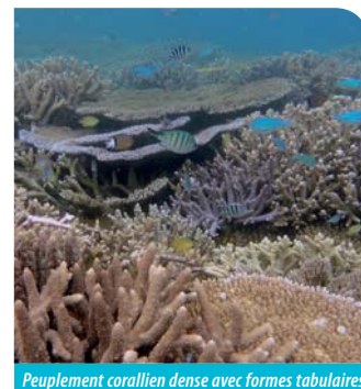
Peuplement corallien dense avec formes tabulaires