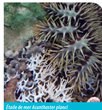
Étoile de mer Acanthaster planci