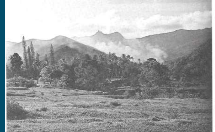
N° 4 - Les crêtes connues enserrant la vallée, les arbres familiers dissimulant les cases, l'eau claire et le brûlis prometteur de futures récoltes, dessinent le cadre immuable du « séjour paisible » (vallée de Houailou, octobre 1970).